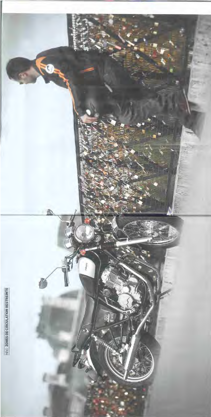
MAG ZONES DE CIRCULATION RESTREINTE

PAS DE CITOYENS DE SECONDE ZONE ! NON A L'ÉCOLOGIE PUNITIVE !