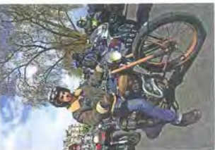
Les associations d'usagers, qui s'inscrivent dans plus de 100 communes, ont obtenu, lors de la dernière édition de la loi de pollution, la possibilité de pratiquer la pollution.

5 PANICE QUE CETTE MESURE INÉGALITAIRE NE SERA PAS SOULÉE Si l'été 2016 aboutira à Paris par une interdiction de circuler pour de nombreux véhicules pas assez récents au regard des autorités qui font un lien simpliste avec la pollution de l'atmosphère, les récents véhicules récents ont été rendus compatibles de fraudes aux émissions polluantes, selon le rapport il s'achèvera par la fermeture des voies sur