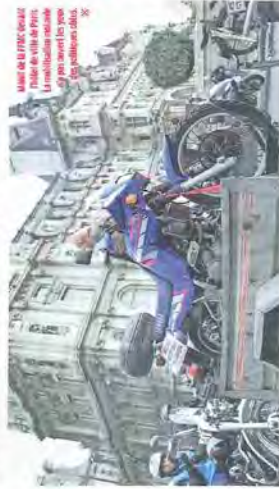
Même si les zones interdites à 15 ans sont nombreuses, la circulation des véhicules à deux roues n'est pas interdite dans les communes concernées.

A ces zones déjà dépeintes, il convient d'ajouter 3 collectivités locales, "en devenir" : la métropole de Clermont-Ferrand (1 600 053 habitants), la communauté d'agglomération de la Vallée de la Maye (244 000 hab.) et celle du Havre (241 860 hab.). Ainsi, une fois ces collectivités "concrètement" prises en compte, on arrive à un total de 735 communes (2 667 746 hab.) et Saint-Maur-des-Fossés (714 176 hab.). Non, merci !