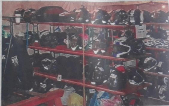
Un service apprécié des motards, très nombreux le soir de la Fête du lac.

Les consignes - gratuites - seront ouvertes de 14 heures à minuit. Les points de consigne sont également signalés sur la communication de la Fête du lac